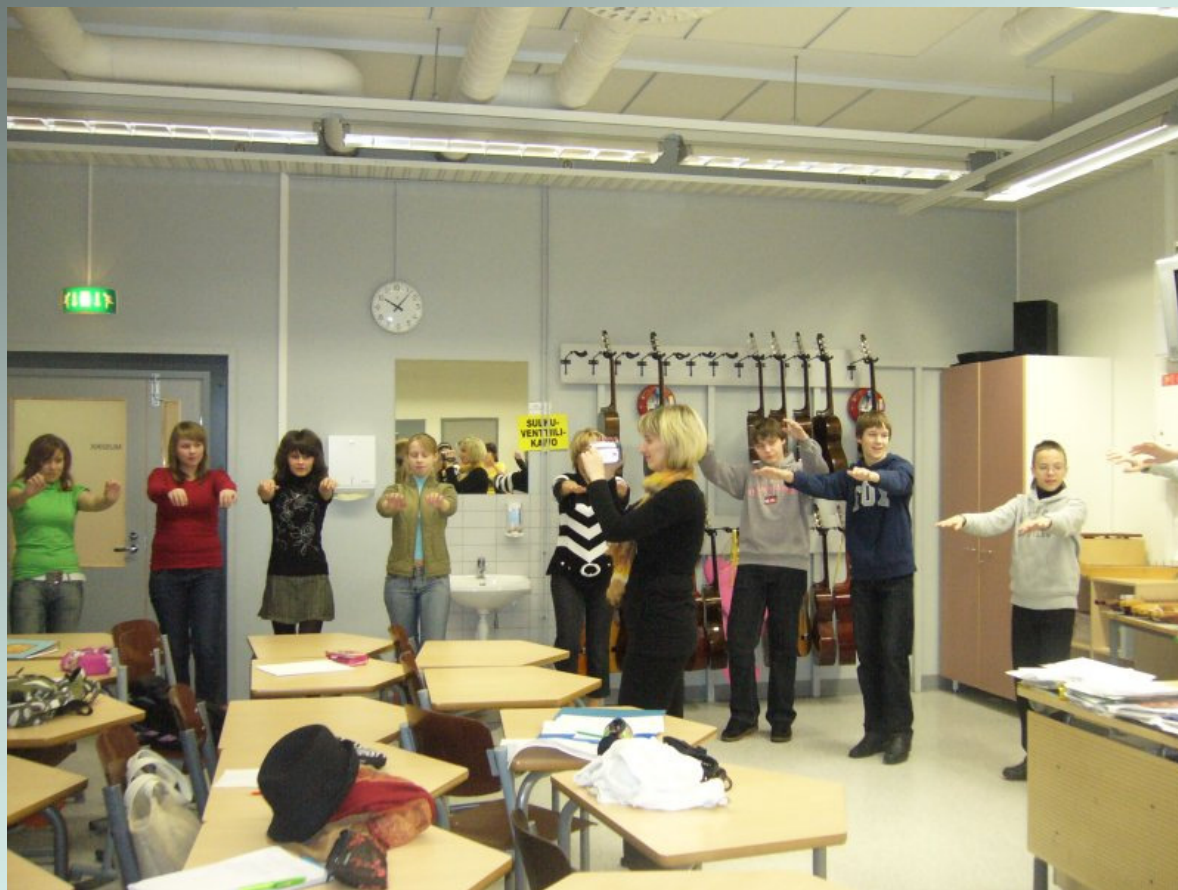
Venäläiset vierailmassa musiikin tunnilla